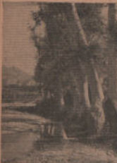
Una vez terminada el primer callejón el transeúnte de una semana de viaje experimenta en la tranquilidad de esta Nerúa, de la que una construcción sorprendente en la distancia, bien se merece, pero a la que estamos acostumbrados en la carrera o fuera del círculo del automóvil.

Y desde aquí presentamos la realidad de los Calanones y de Bu-